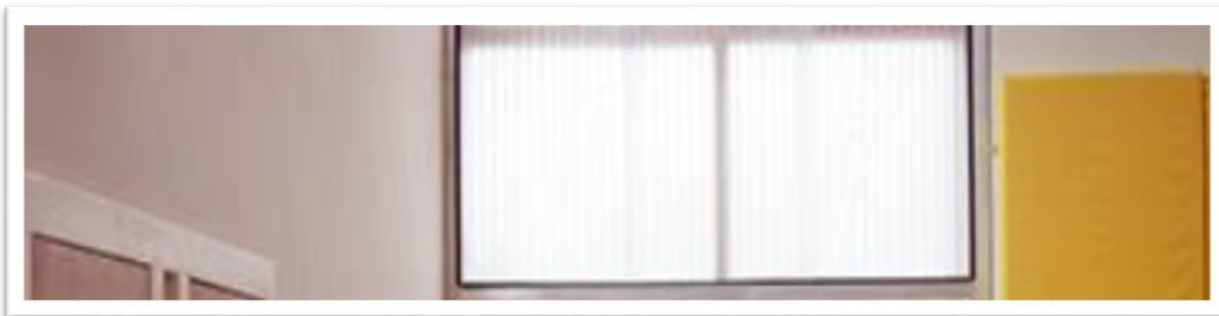
استفاده از شیشه سندبلاست در سقف و دیوار پیرامون آن جهت جذب کنترل شده نور طبیعی محیط