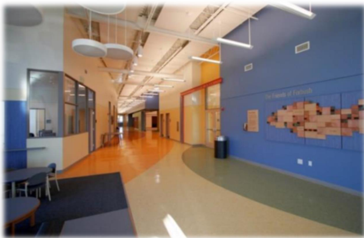
استفاده از تغییر رنگ در کف به منظور جهت یابی در مرکز اوتیسم