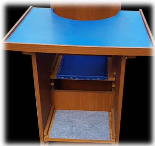
نیمکت لاشکل پیشنهادی جهت کار انفرادی دانش آموز