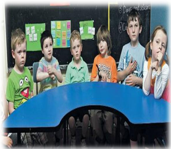
میز کار پیشنهادی جهت تماس چشمی مناسب معلم